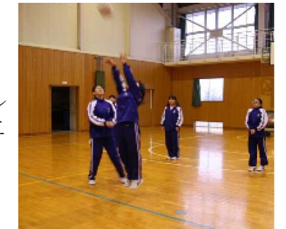
上手にトスが上がったかな?