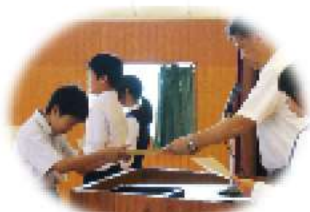
卓球ネット大会2位

3つ目は、「勉強」です。2学期は、1学期や3学期と違いテストが2回あるので、その分、計画的に勉強しなければならないからです。今までは、テスト期間に入ってから慌てて勉強に力を入れることが多かったのですが、今回は2学期の初めからワークに繰り返し取り組むなどしたいです。そして、テスト前に慌てることの無いようにしたいと思います。