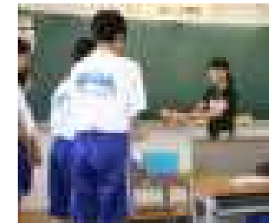
最終日の終学活で1年1組のみんなでメッセージを送りました。

3週間お世話になりました。廊下ですれ違うと元気にあいさつをしてくれ、部活や勉強を頑張る中学生にパワーをもらいながら過ごすことができました。授業では、話を真剣に聞き、質問には積極的に答えてくれてうれしかったです。昼休みや部活動では、いっしょに体を動かすことができとても楽しかったです。 七葉中学校で教育実習を行うことができ本当によかったです。ありがとうございました!