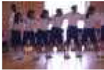
<旗を引く順番をX人Y脚リレーで競いました。>