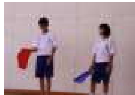
<旗を引いた結果です。>