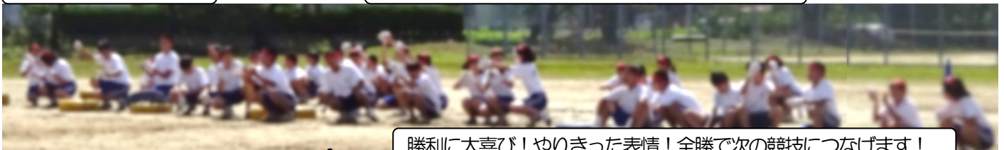
勝利に大喜び！やりきった表情！全勝で次の競技につなげます！