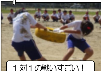
1 対 1 の戦いすごい！