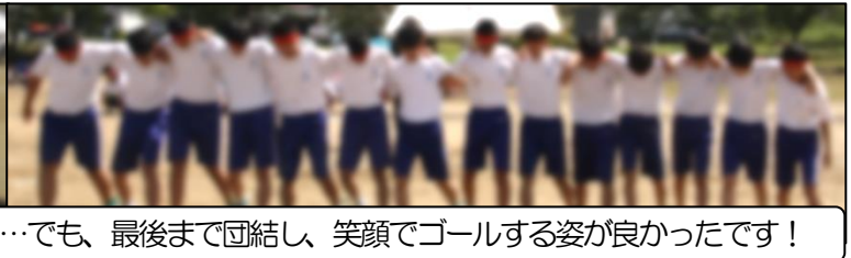
プレッシャーからか、本番は焦ってしまい…でも、最後まで団結し、笑顔でゴールする姿が良かったです！