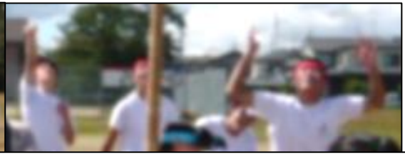
念力を送るも、3 年生の数で負けてしまいました…