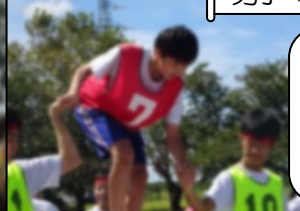
女子、男子共に勝利！上手いかなかったところも声を出し合う姿☆この 2 つの競技で同点に追いつきました！