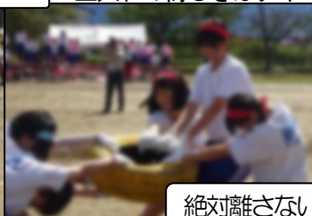
絶対離さない！！仲間の奮闘に周りも駆けつける！