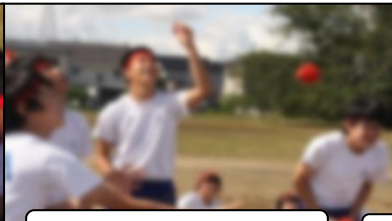
競技中は楽しそう！！